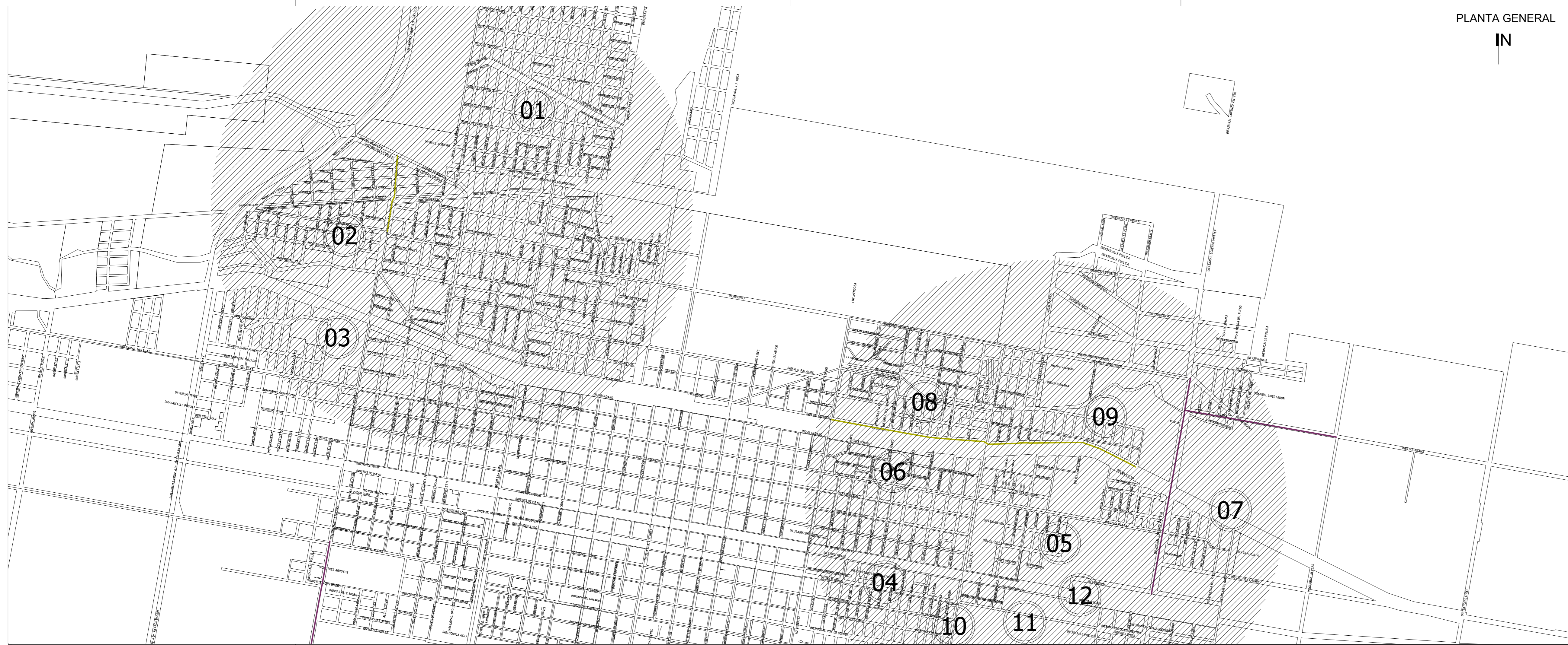
PLANTA GENERAL IN