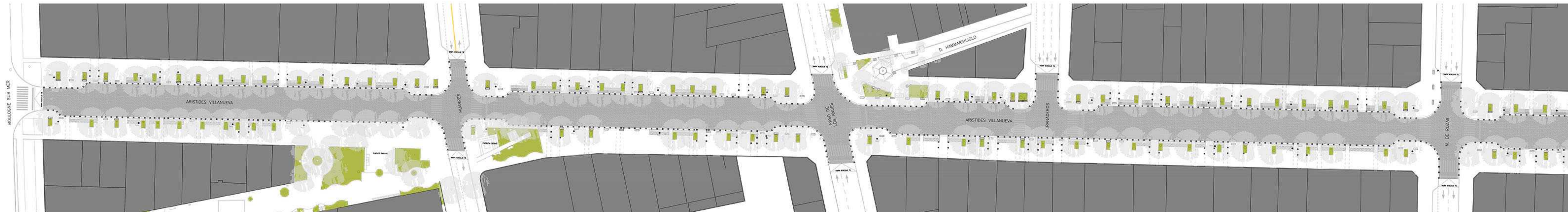
PLANIMETRIA esc. 1:500