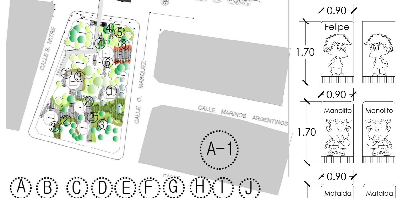
DISTRIBUCIÓN DE VEGETACIÓN