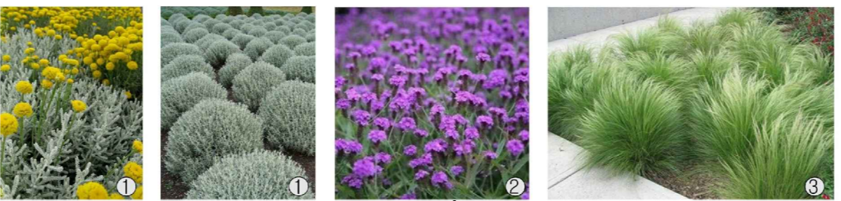
REFERENCIA DE VEGETACION Y CUBRE SUELOS