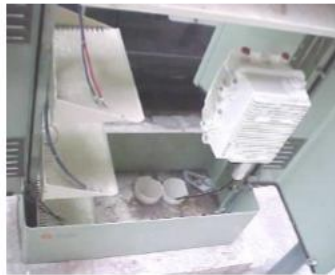
Vista de la salida de los conductos de PVC