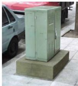
Pedestal de base embutida