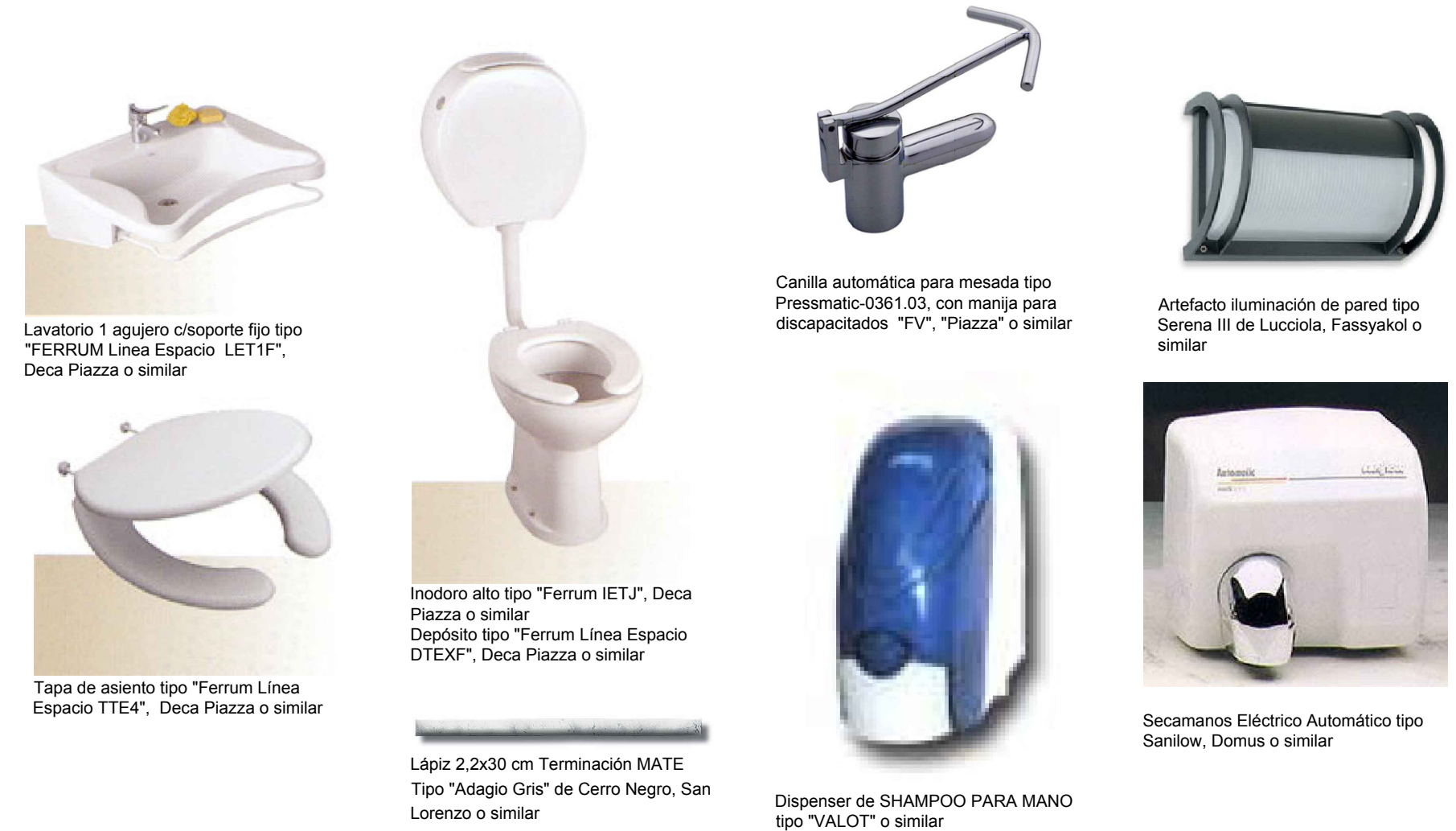
IMAGENES DE REFERENCIA