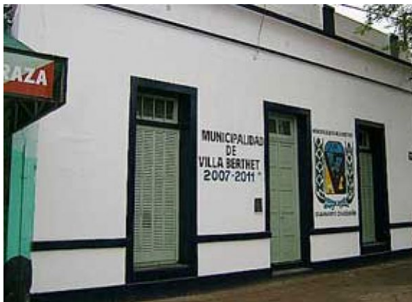
Municipalidad de Villa Berthet