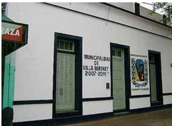
Municipalidad de Villa Berthet