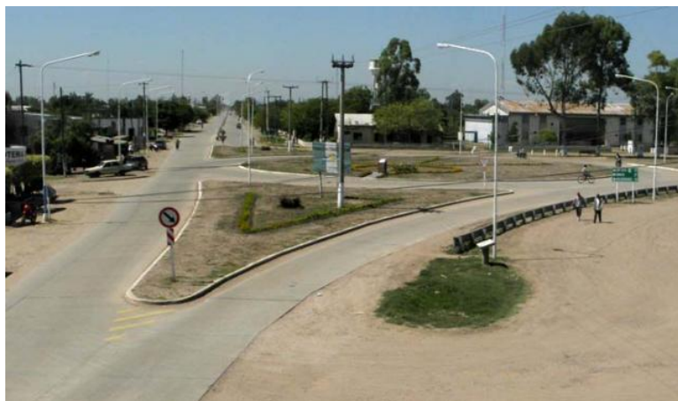
Acceso a Villa Berthet

Sus principales vías de acceso lo constituyen las rutas provinciales 4 y 6. La ruta Provincial 4 la comunica por asfalto al sur con Samuhú y al norte con Quitilipi. La ruta Provincial 6 por su parte la enlaza al oeste por asfalto con San Bernardo y Las Breñas, y al este (camino terrado) con Haumonia.