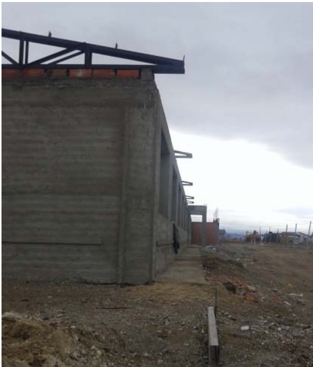
Veredas perimetrales sobre frente principal