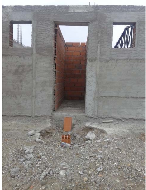
Cámaras Inspección en ducto sanitario