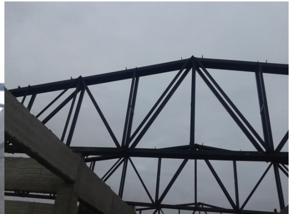
Pasillo circulación interior – Vista desde acceso/salida lateral