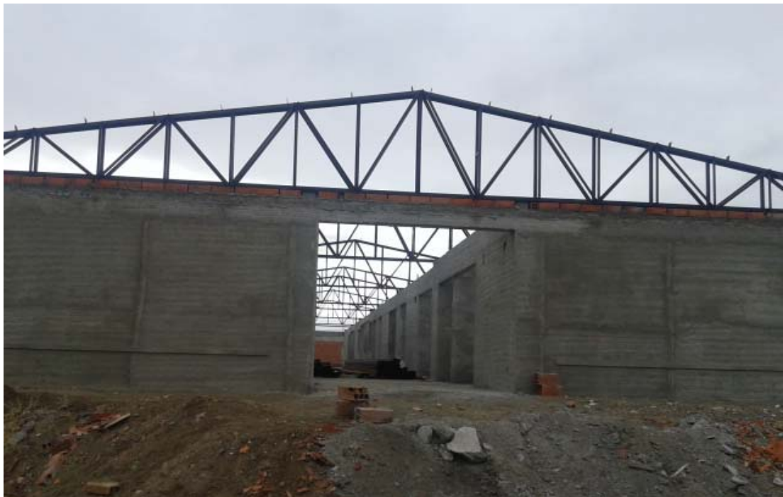
Vista acceso/salida lateral sector aulas