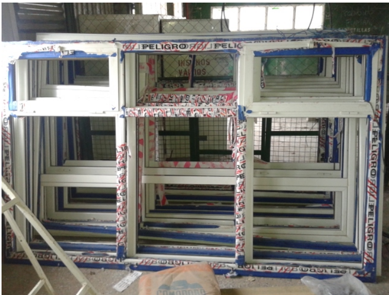
Ventanas CEA2 acopiada fuera de obra (Cant.:14)