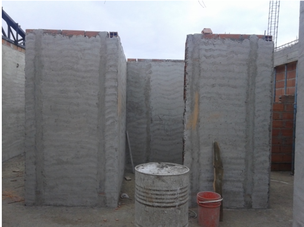
Núcleo sanitario alumnos