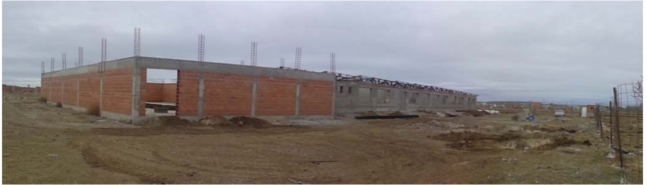
Vistas sector SUM