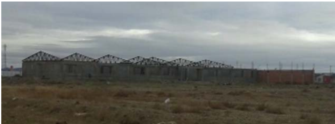
Vista general del edificio.