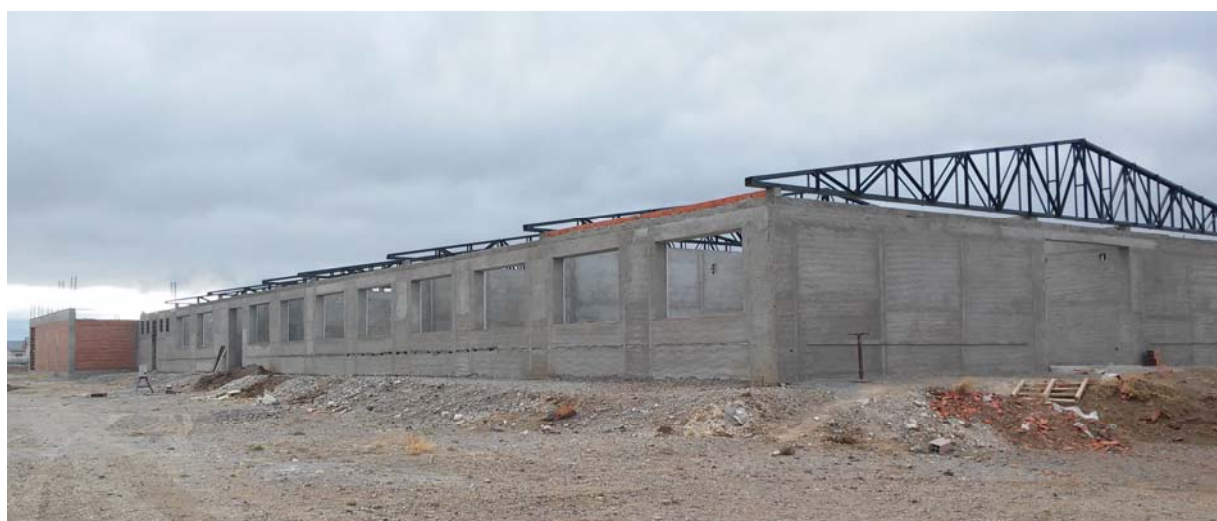
Vistas sector aulas