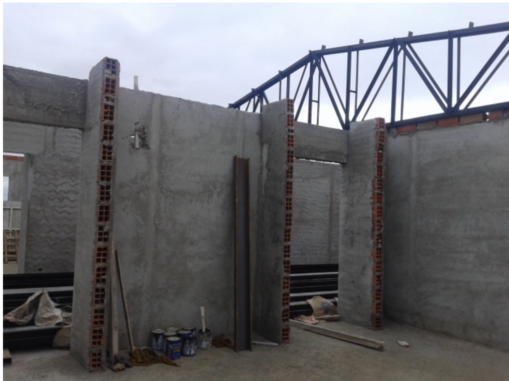
Aulas – Vista hacia el pasillo interior