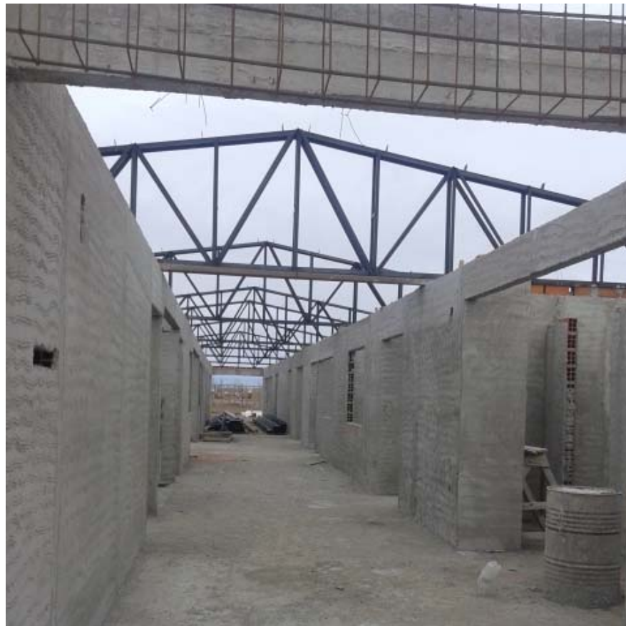
Pasillo circulación interior desde SUM