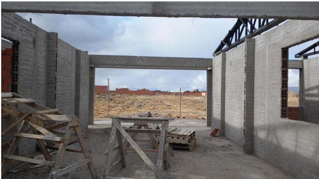
Hall acceso principal