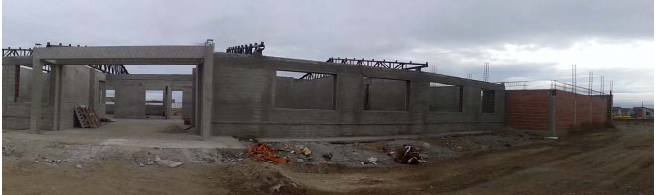
Vista exterior acceso principal