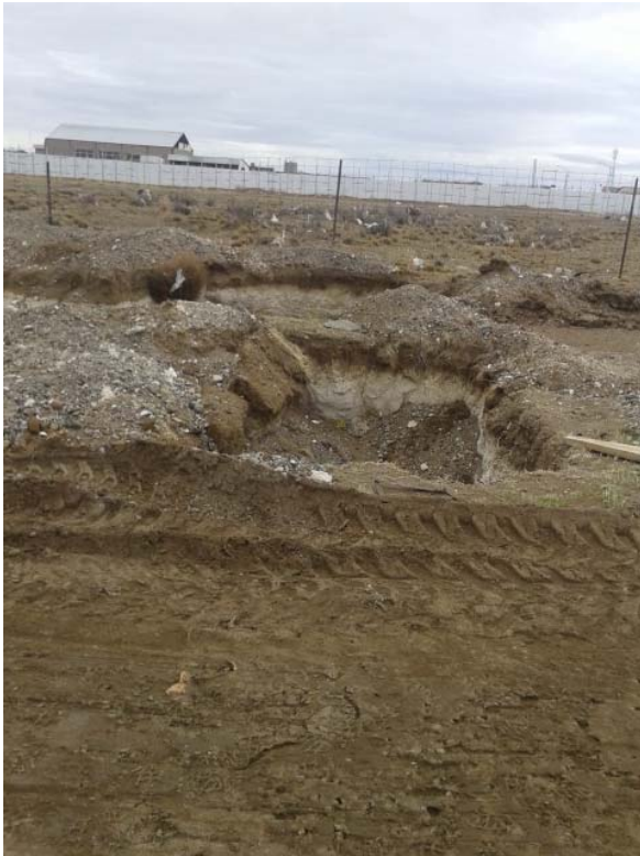
Excavación para cámara séptica y pozo absorbente