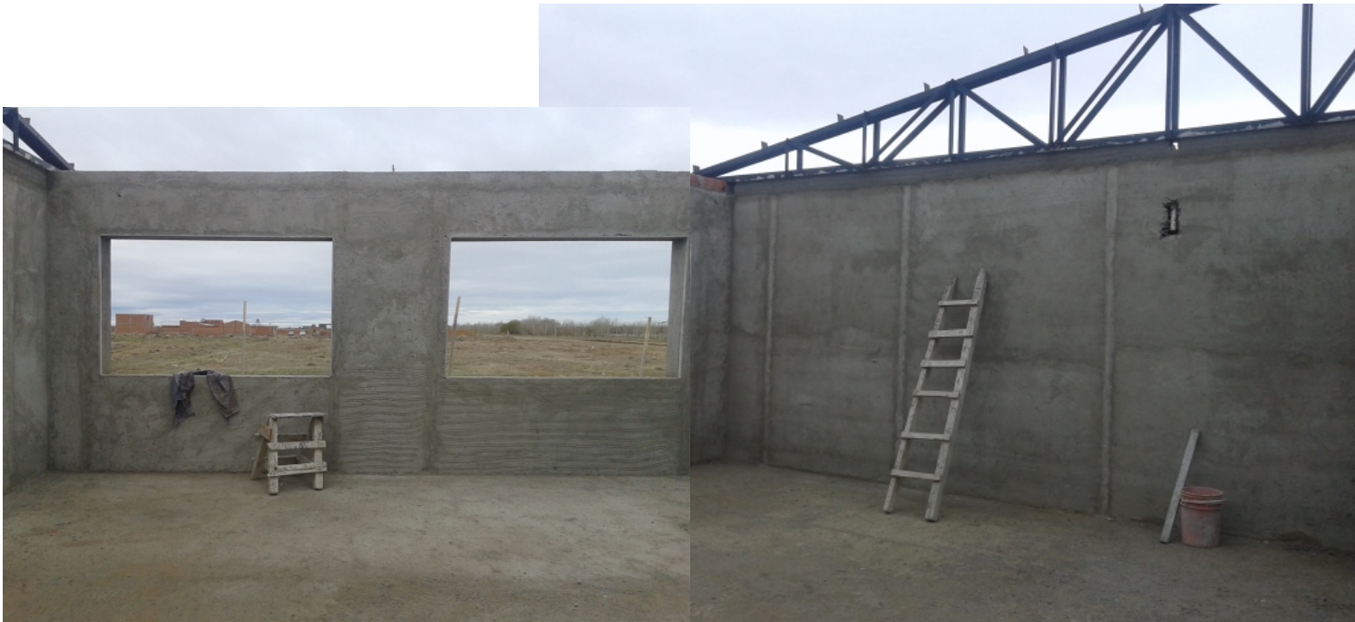
Aulas – Vista hacia el exterior