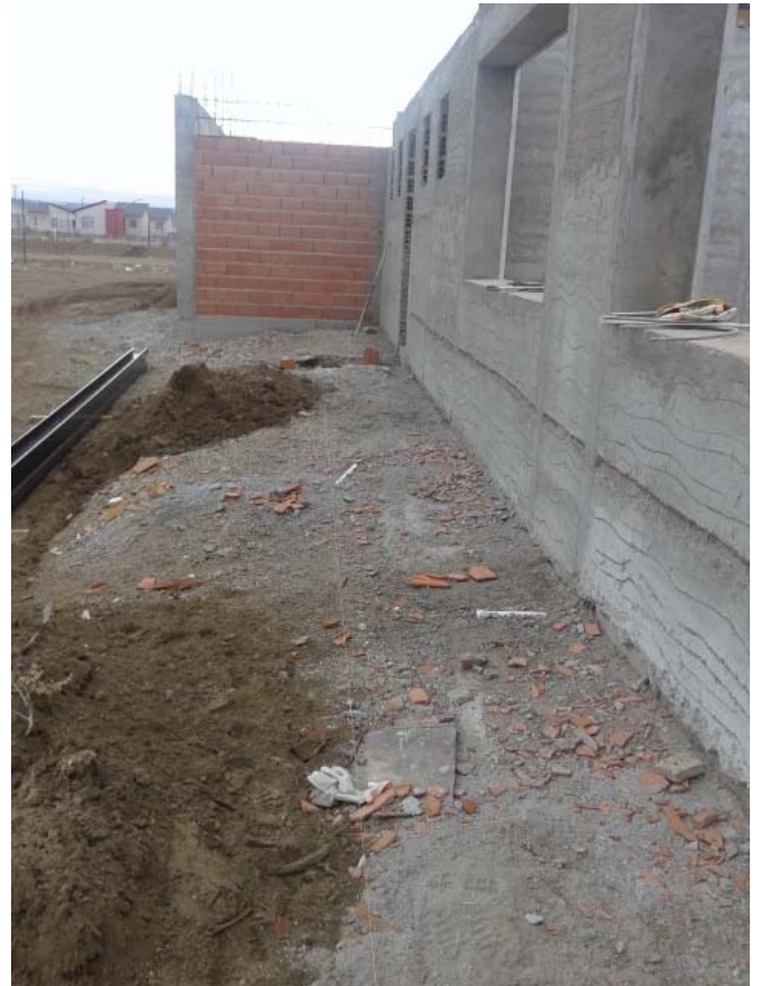
Desagüe principal Laboratorio