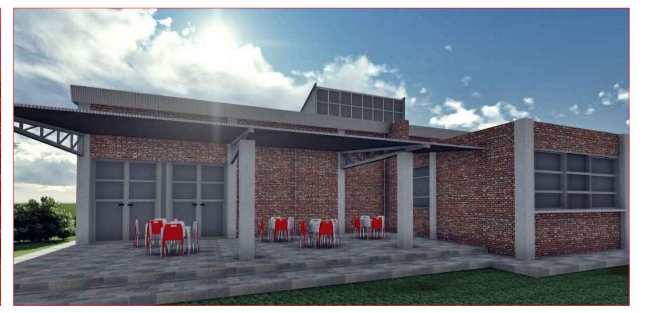
COMEDOR IMAGENES EXTERIORES