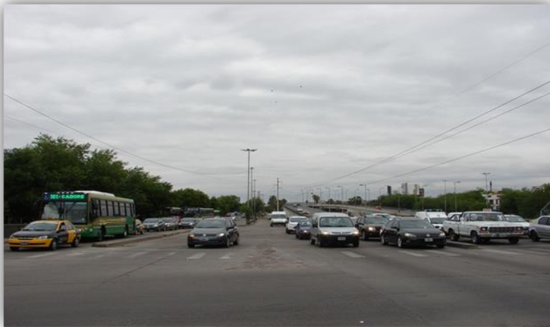
Foto: Congestión vehicular en Av. Costanera