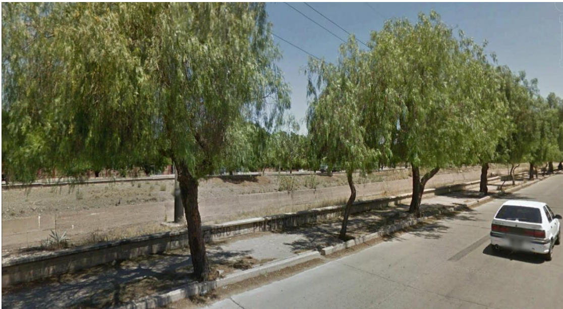
Foto: Imagen deteriorada del espacio público