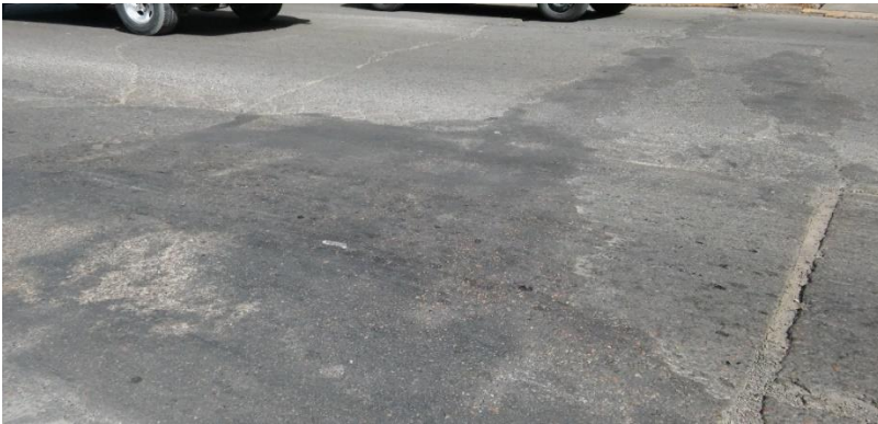
Foto: Deterioros actuales en Av. Costanera