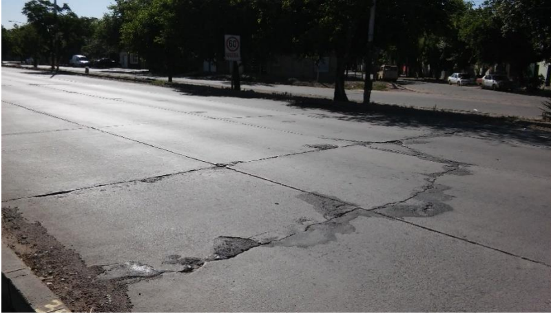
Foto: Deterioros actuales en Av. Costanera