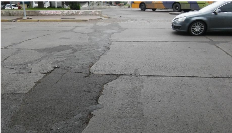
Foto: Deterioros actuales en Av. Costanera

Los problemas de carácter formal, se presentan asociados a la imagen negativa del espacio público y su entorno urbano en el acceso a Mendoza. Siendo la Costanera la única vía de acceso desde el Norte a la Provincia, presenta una estética paisajística deteriorada, que no responde a los estándares actuales.