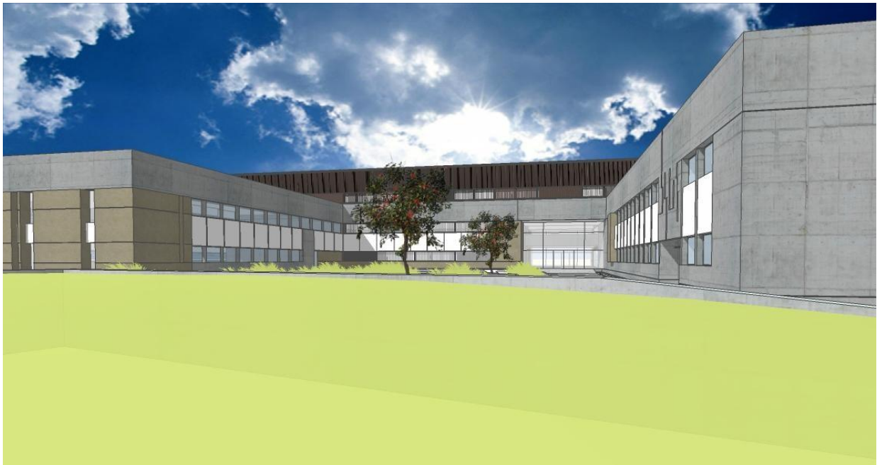
Perspectiva desde plaza central