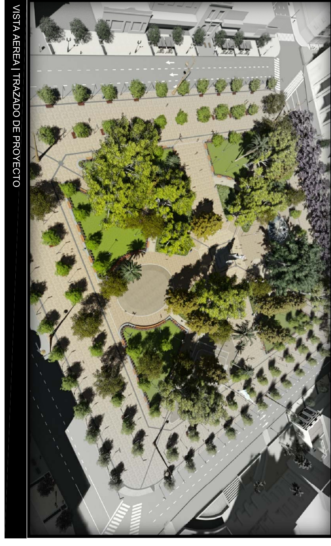
VISTA AEREA | TRAZADO DE PROYECTO