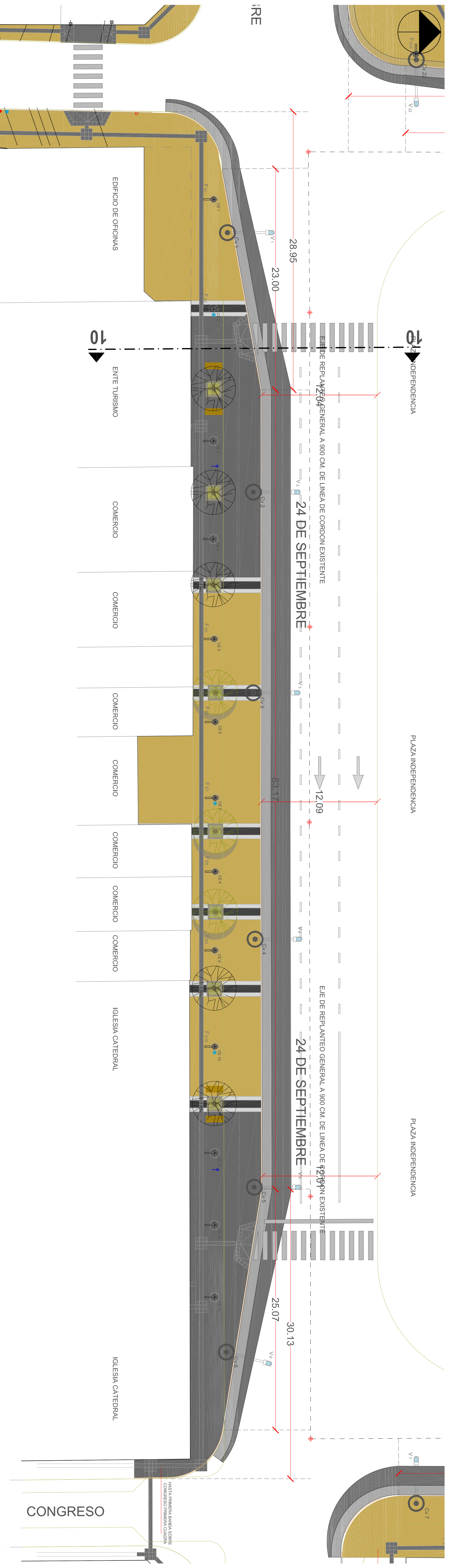
VISTA GENERAL DE CONJUNTO | ENTORNO PLAZA INDEPENDENCIA | CALLE 24 DE SEPTIEMBRE AL 400