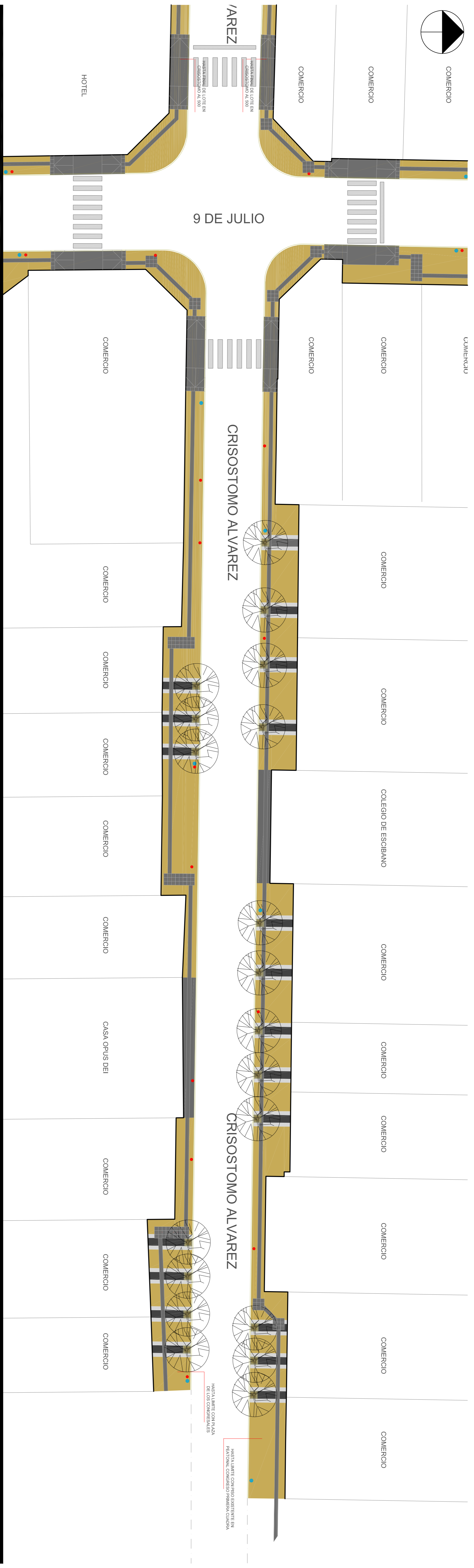
VISTA GENERAL | CALLE CRISOSTOMO ALVAREZ AL 400