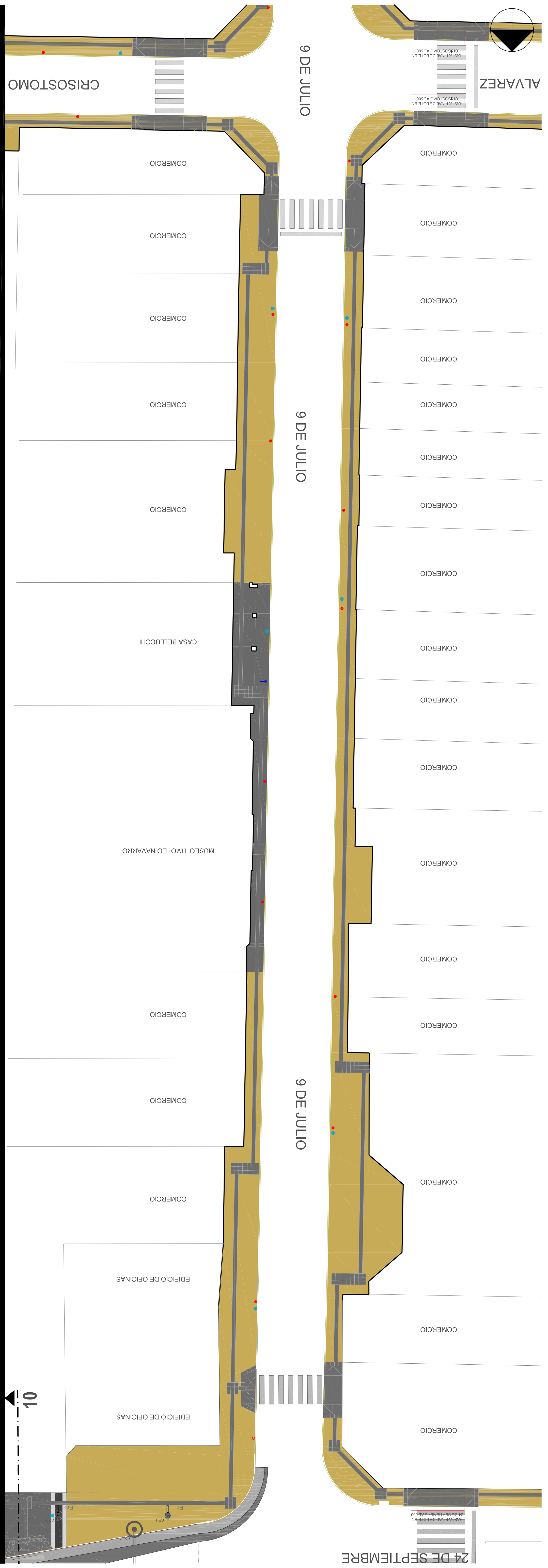
VISTA GENERAL | CALLE 9 DE JULIO 000