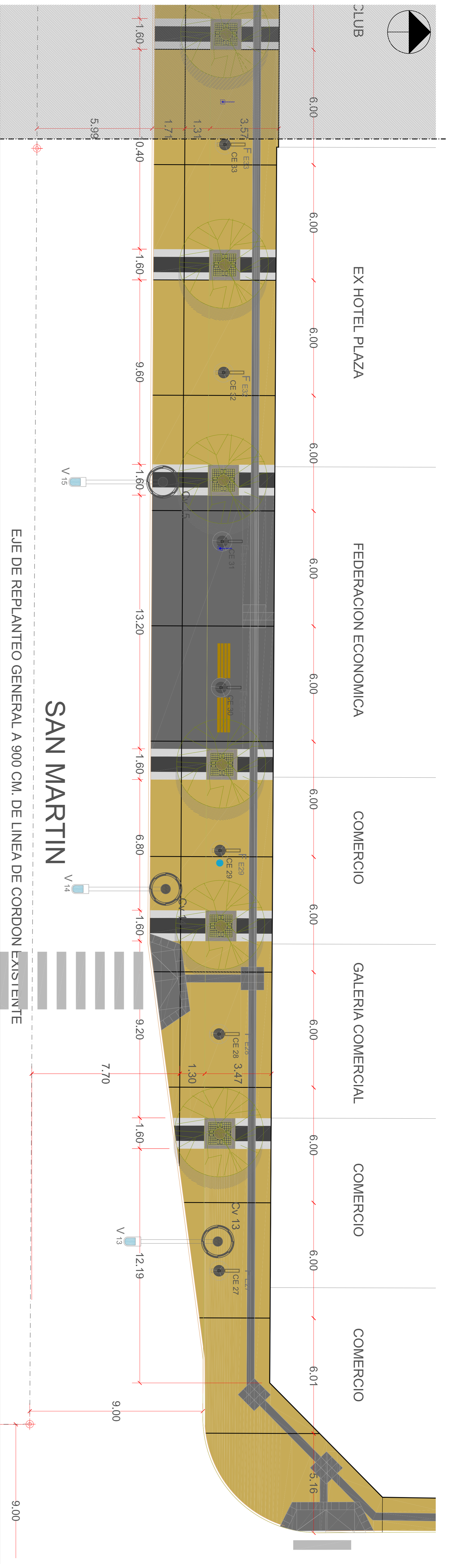
SECTOR ESTE | CALLE SAN MARTIN | JUNTAS DE DILATACION | 1 : 100