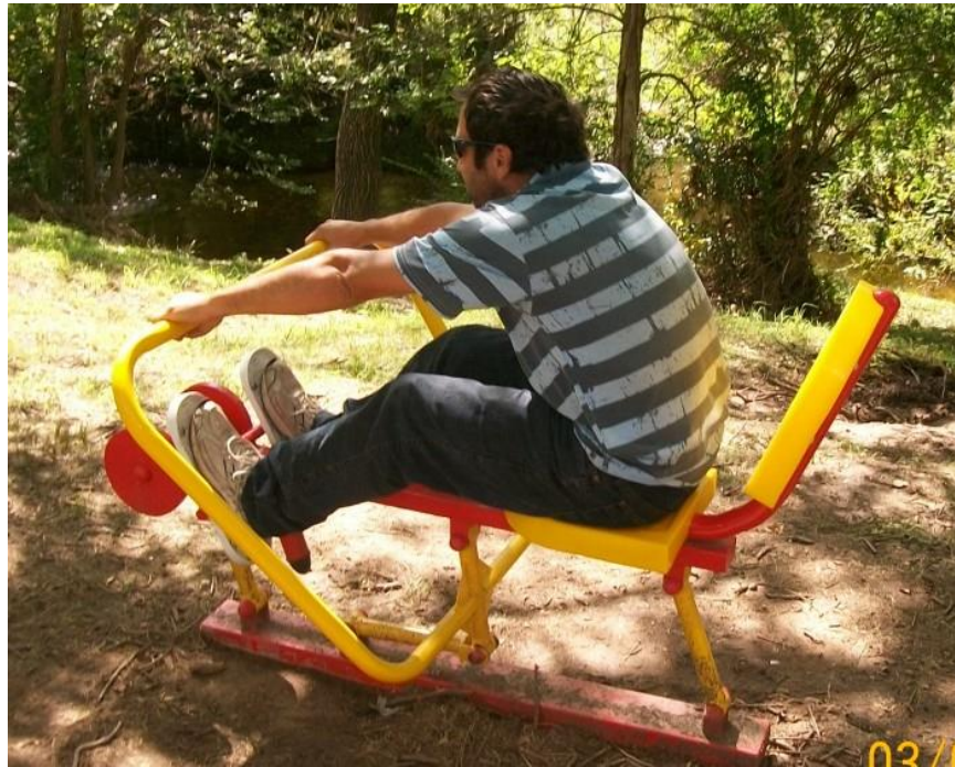
Imagen de referencia. Remo simple.

Los trabajos descriptos precedentemente, se medirán y se pagarán Unidad (U) y recibirán pago por medio del Sub-Rubro 7.3.3 "Remo Simple", siendo compensación total por la ejecución de los trabajos de acuerdo a lo especificado. Todo a entera satisfacción de la Inspección de Obra y de acuerdo a las reglas del buen arte.