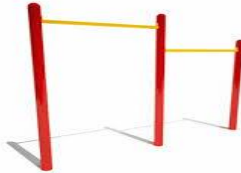
Imagen de referencia. Barras.