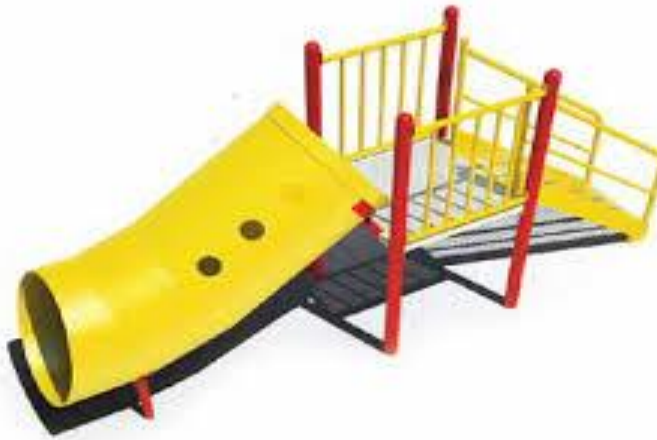
Imagen de referencia. Tobogán de tubo recto