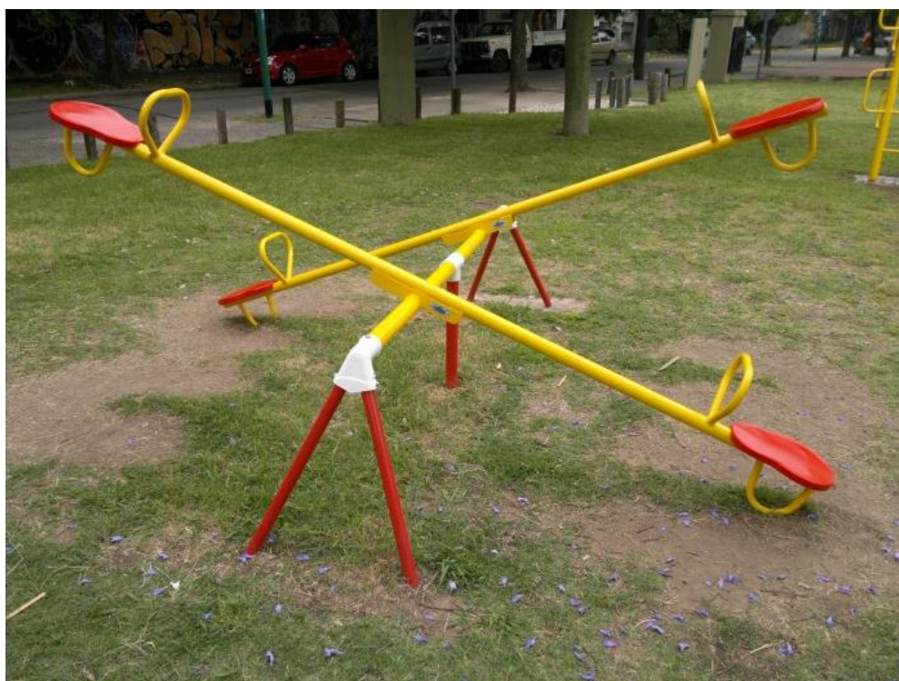
Imágen de referencia. Sube y baja doble.

Los trabajos descritos precedentemente, se medirán y se pagarán Unidad (U) y recibirán pago por medio del Sub-Rubro 7.2.1 "Sube y Baja Doble", siendo compensación total por la ejecución de los trabajos de acuerdo a lo especificado. Todo a entera satisfacción de la Inspección de Obra y de acuerdo a las reglas del buen arte.