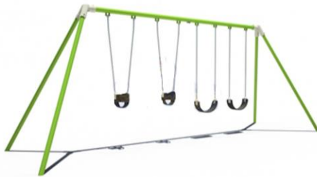
Imagen de referencia. Hamaca cuádruple.

Los trabajos descritos precedentemente, se medirán y se pagarán Unidad (U) y recibirán pago por medio del Sub-Rubro 7.2.2 "Hamaca de 4 asientos", siendo compensación total por la ejecución de los trabajos de acuerdo a lo especificado. Todo a entera satisfacción de la Inspección de Obra y de acuerdo a las reglas del buen arte.