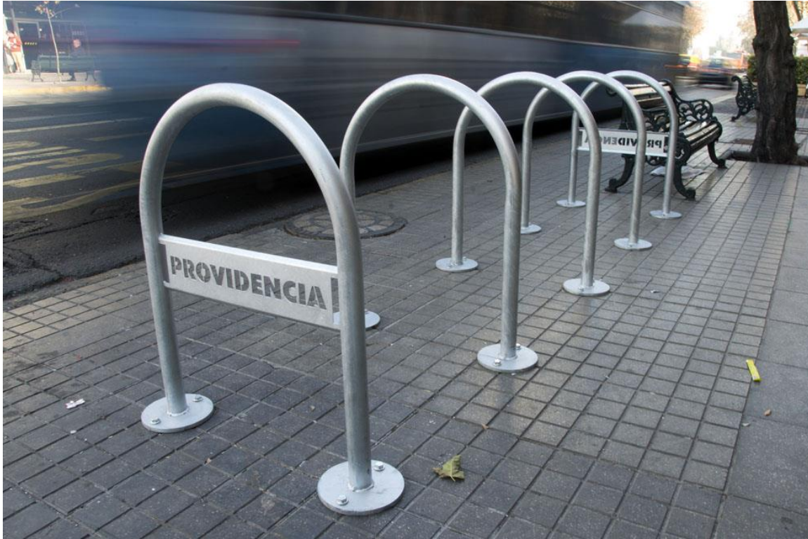
Imagen de referencia. Biciadero