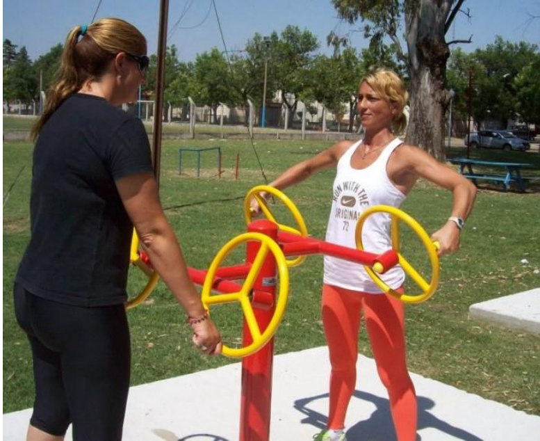
Imagen de referencia. Volantes cuádruples.