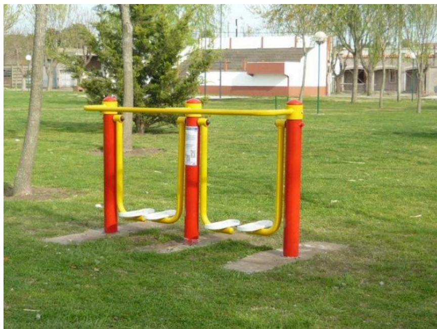
Imagen de referencia. Caminador aéreo doble.

Los trabajos descriptos precedentemente, se medirán y se pagarán Unidad (U) y recibirán pago por medio del Sub-Rubro 7.3.4 "Caminador aéreo doble", siendo compensación total por la ejecución de los trabajos de acuerdo a lo especificado. Todo a entera satisfacción de la Inspección de Obra y de acuerdo a las reglas del buen arte.