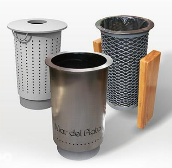
Imagen de referencia: Cesto acero inoxidable con nombre de ciudad