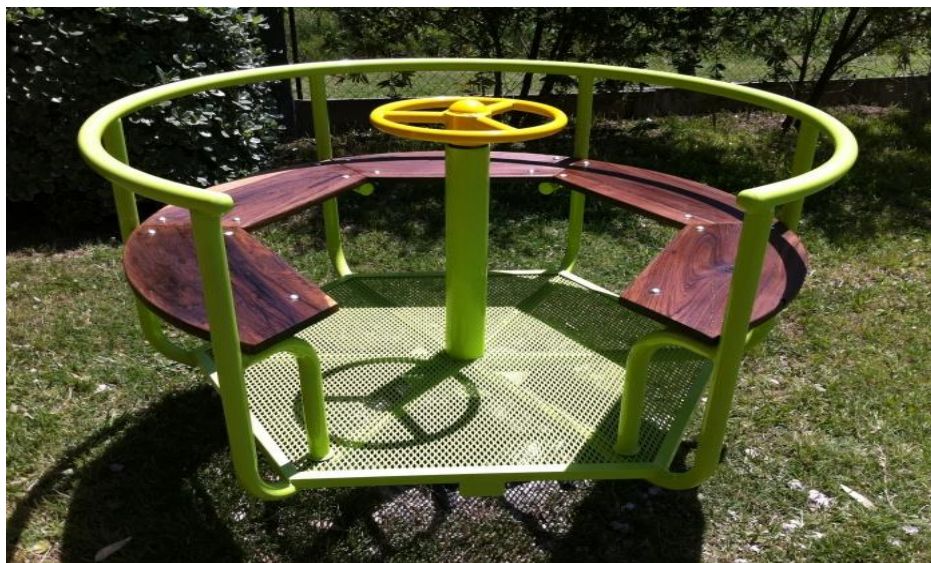
Imagen de referencia. Calesita.

Los trabajos descriptos precedentemente, se medirán y se pagarán Unidad (U) y recibirán pago por medio del Sub-Rubro 7.2.3 "Calesita de asientos de madera", siendo compensación total por la ejecución de los trabajos de acuerdo a lo especificado. Todo a entera satisfacción de la Inspección de Obra y de acuerdo a las reglas del buen arte.