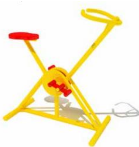
Imagen de referencia. Bicicleta fija.

Los trabajos descriptos precedentemente, se medirán y se pagarán Unidad (U) y recibirán pago por medio del Sub-Rubro 7.3.1 "Bicicleta Fija", siendo compensación total por la ejecución de los trabajos de acuerdo a lo especificado. Todo a entera satisfacción de la Inspección de Obra y de acuerdo a las reglas del buen arte.